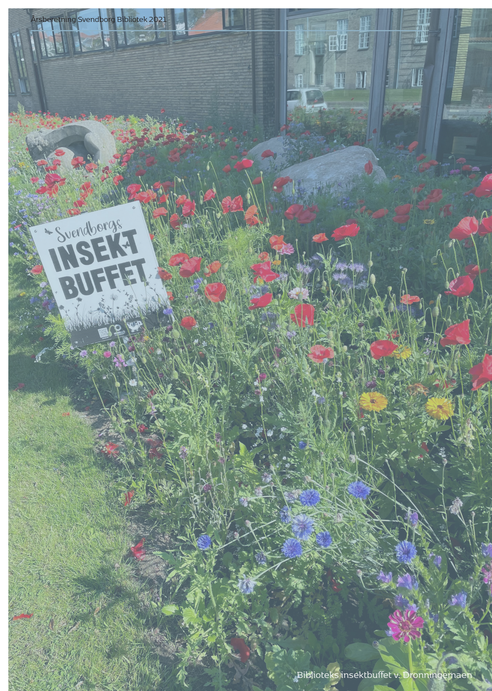
Biblioteks insektbuffet v. Dronningemaen

Udover at pynte i landskabet og bidrage til biodiversiteten skabte insektbuffetten samtaler med lånere, turister og andre besøgende, der ikke er forstummet, selvom den forlængst er blomstret af.